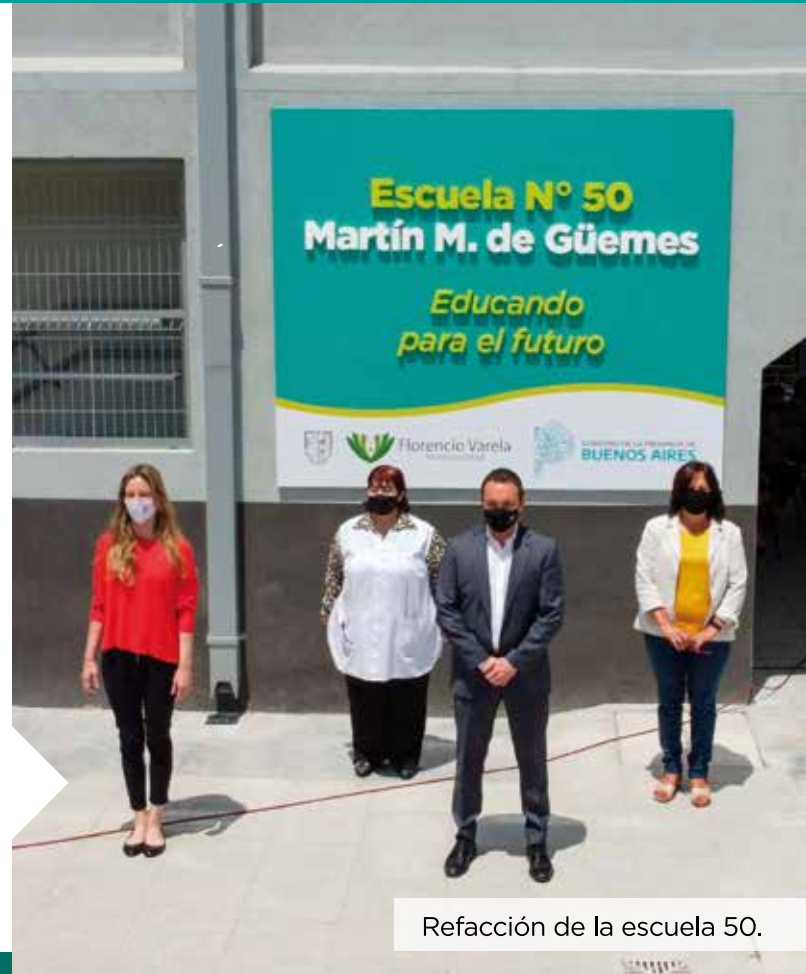
Refacción de la escuela 50.