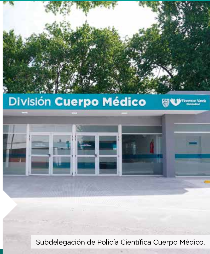
Subdelegación de Policía Científica Cuerpo Médico.