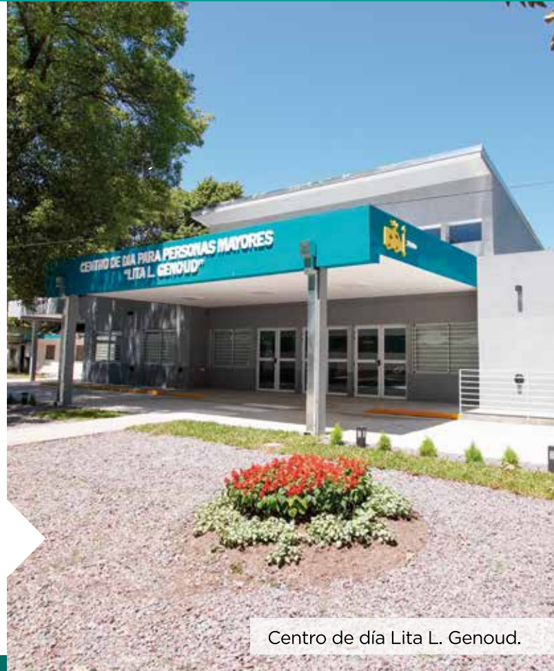
Centro de día Lita L. Genoud.