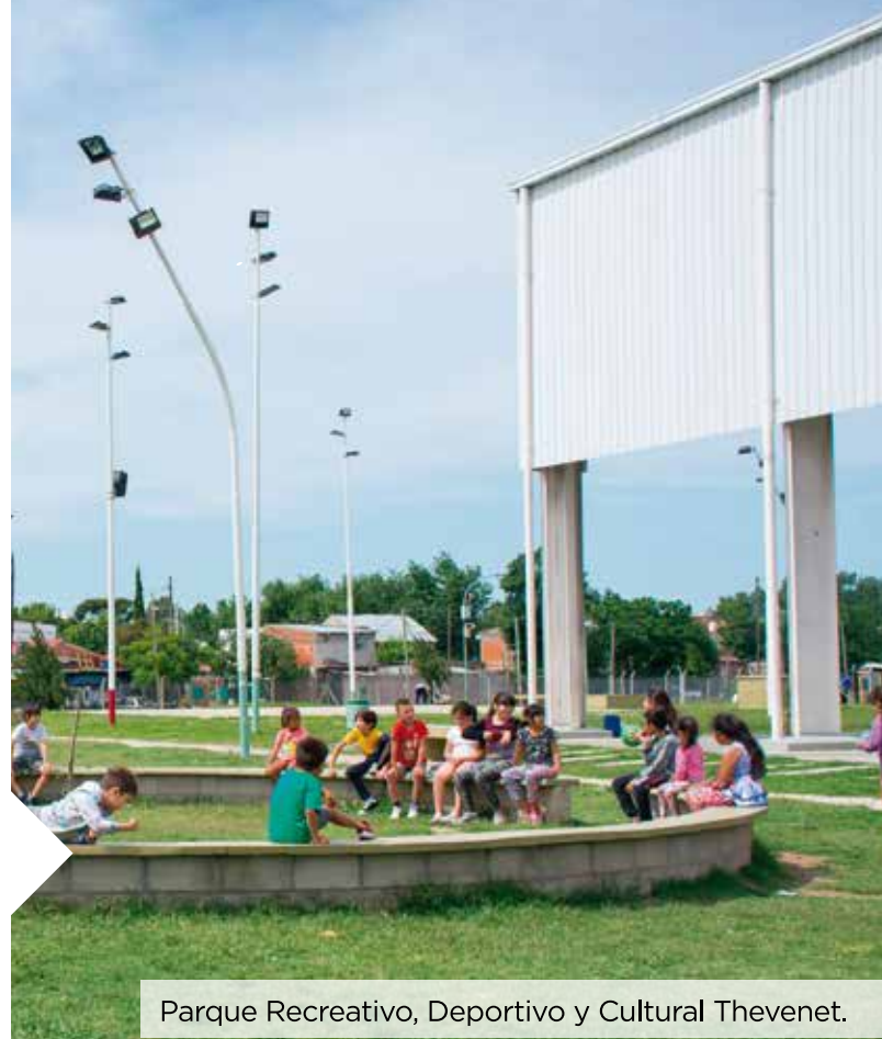
Parque Recreativo, Deportivo y Cultural Thevenet.