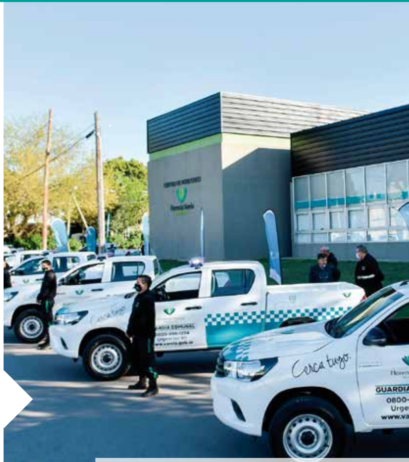
Nuevas camionetas para la Guardia Comunal.