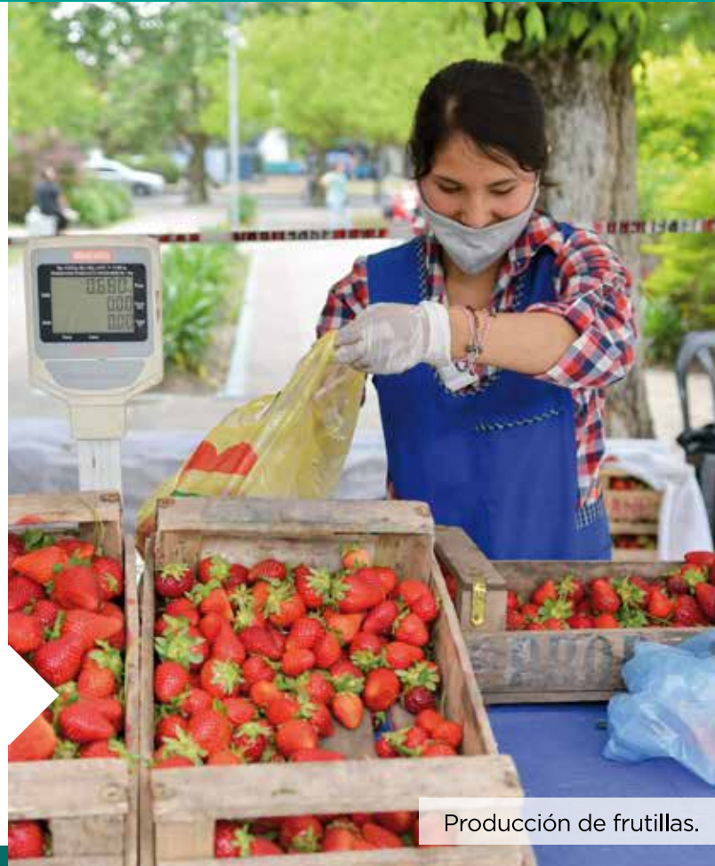
Producción de frutillas.