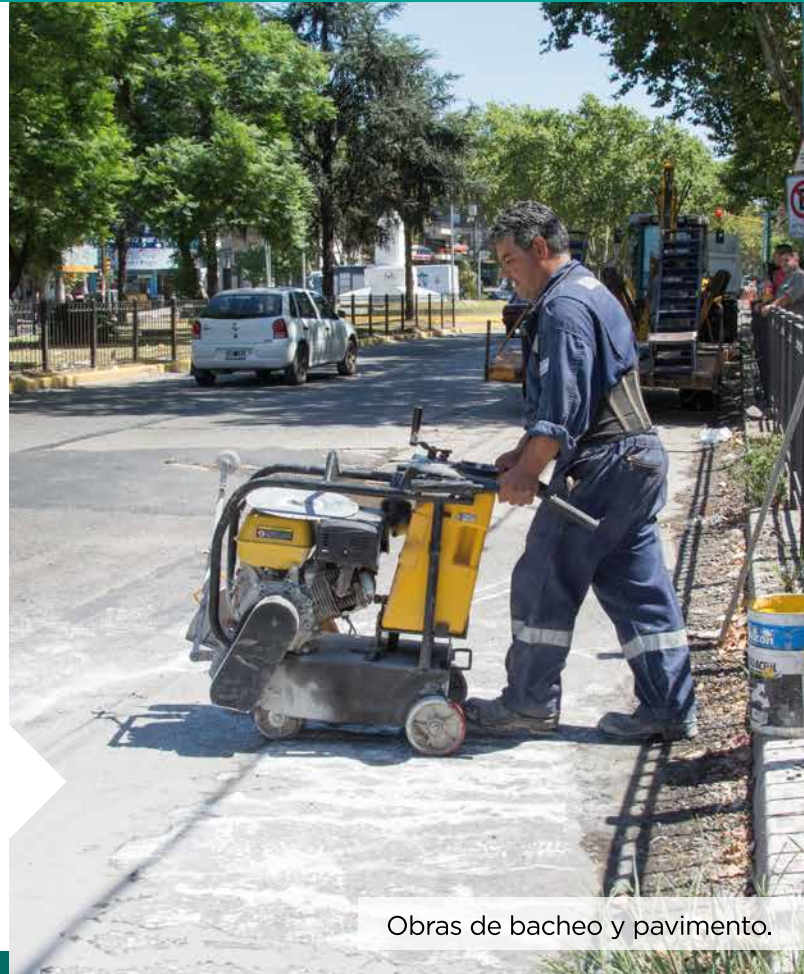
Obras de bacheo y pavimento.